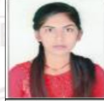
Photo and Signature